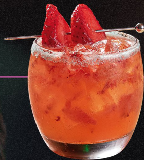
HAMBRIENTO Y SIN PLATA