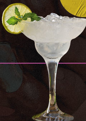
MARGARITAS -FRESA -MARACUYÁ -LIMÓN