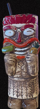
DULCE Y ATREVIDO

INGREDIENTES: BACARDI, mezclador rosa Sirope de lychee, limón hierba buena