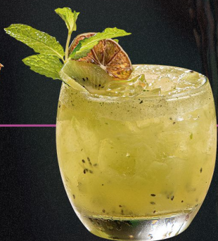
TRISTE Y ABANDONADO