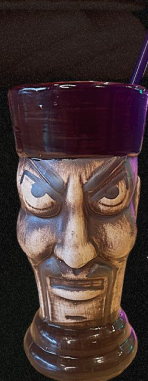
LLÉVAME A VIETNAM

INGREDIENTES: Seco herrerano, brandy top de vino, lychee rose club soda