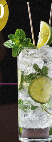
MOJITOS -FRESA -MANGO -MARACUYÁ -KIWI -LIMÓN