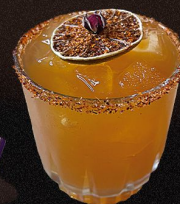
DONDE HUBO FUEGO

INGREDIENTES: Malibu, combinado con ginebra, goma Top de piñas en trozos y menta, goma