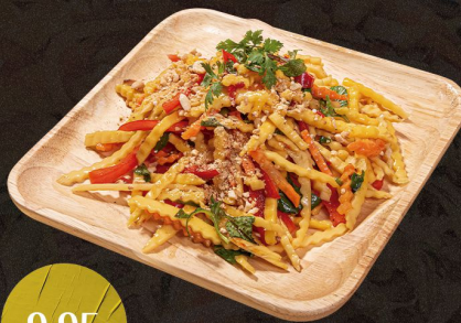
ENSALADA DE REPOLLO CON POLLO CABBAGE SALAD WITH CHICKEN