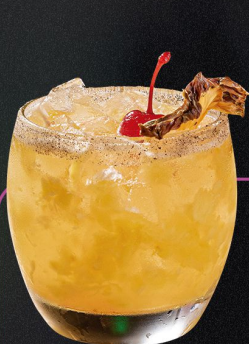
CONTENTO Y MANTENIDO