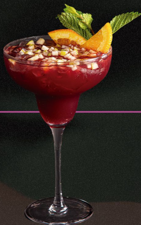
SANGRÍA TINTA O BLANCA